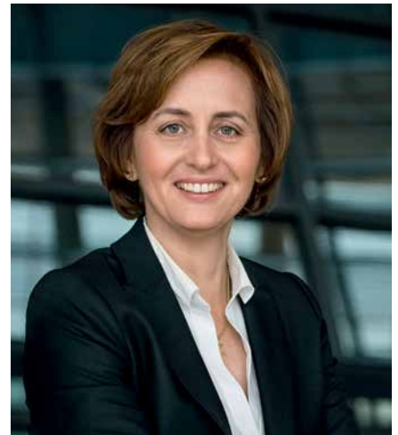
Beatrix von Storch (stellv. Vors. Bundesprogrammkommission)